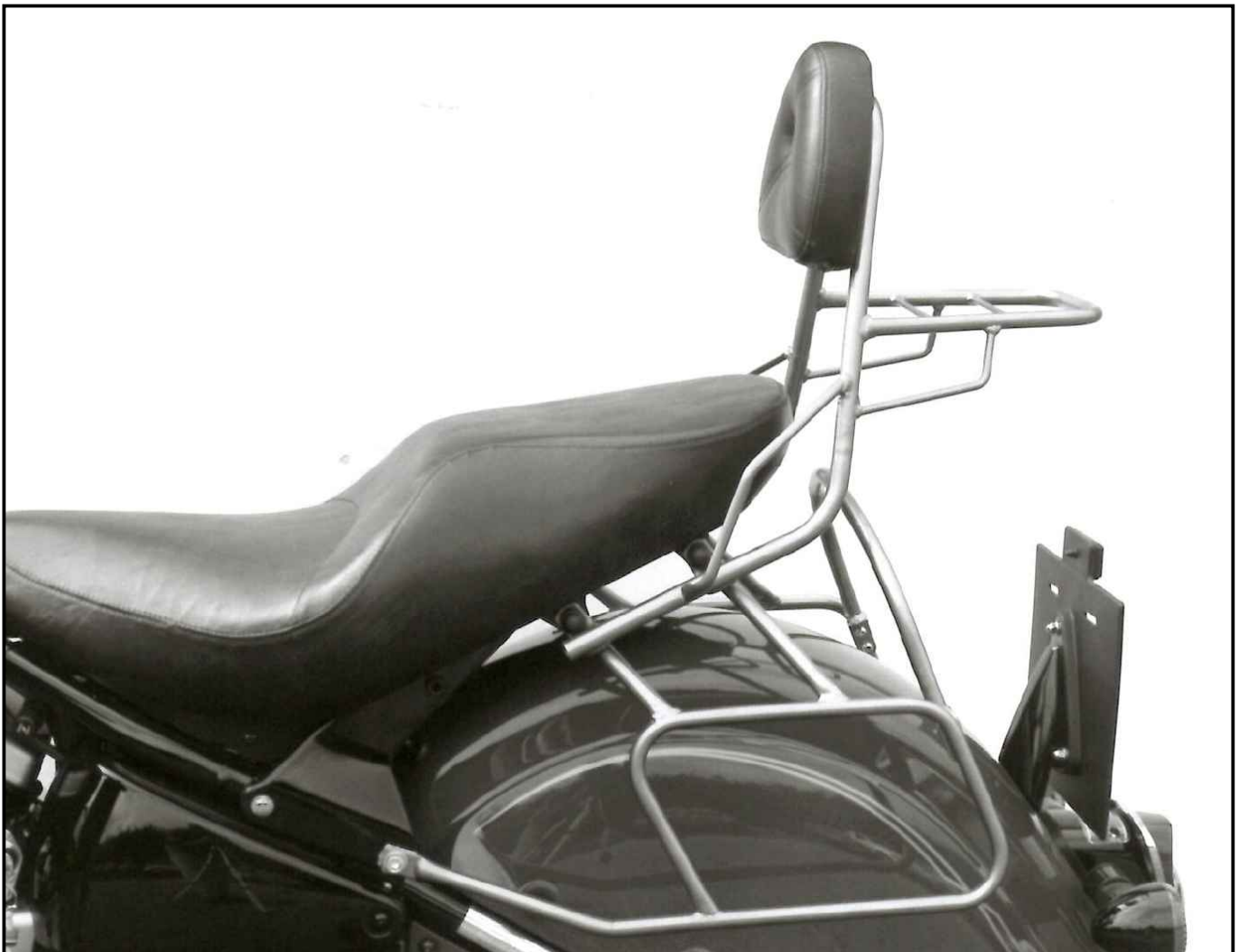
Foto zeigt Sissybar mit Gepäckbrücke in Kombination mit Satteltaschenhalter Picture shows the Sissybar with rear rack in combination with a leather bag holder.