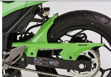
Kawasaki Z 300