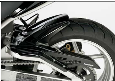
Kawasaki Versys 650