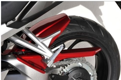
Honda VFR 800