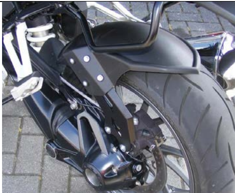
BMW R1200R / R1200RS