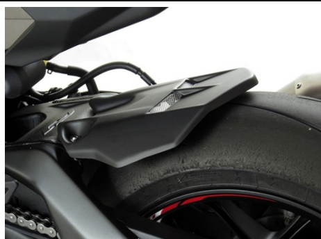
Yamaha YZF-R1 2015