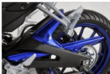
Yamaha YZF-R125 / MT-125