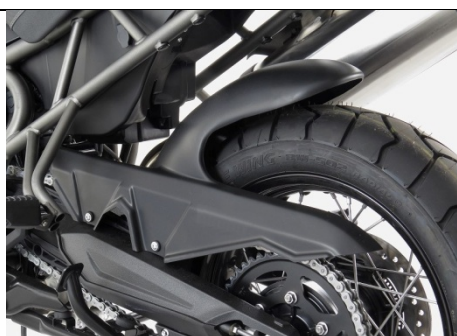
Triumph Tiger 800 XCX/XRX