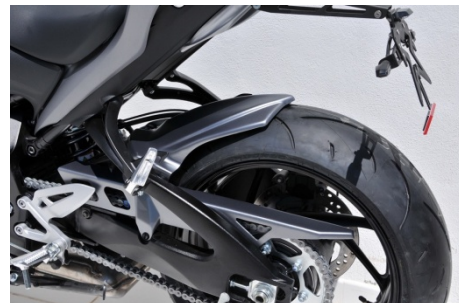
Suzuki GSX-S 1000