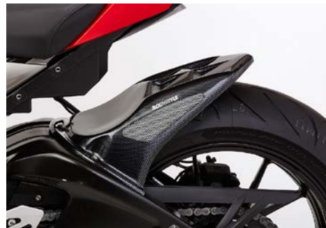
BMW S1000RR / S1000XR