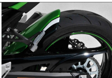
Kawasaki Z 900