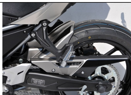
Kawasaki Z 650/Ninja 650