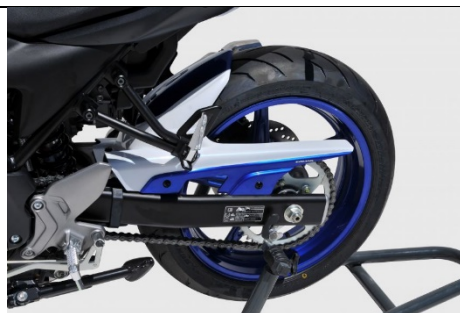
Suzuki SV 650/A