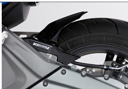
BMW C650 Sport