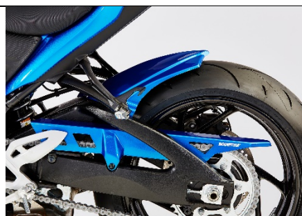
Suzuki GSX-S 750